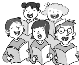
coro – corro

Y escribe una oración con cada palabra que has rodeado.