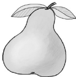
pera – perra