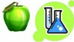
Chemical Energy Food Energy