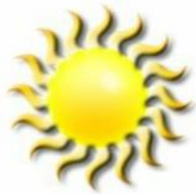
Light Energy (Radiant)