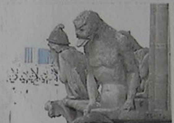
Quimeras en la fachada de la Catedral de Notre-Dame.

Las torres tienen 69 metros de altura. La torre sur contiene la famosa campana Emmanuel . Puede visitarse, pasando por la galería de las quimeras.