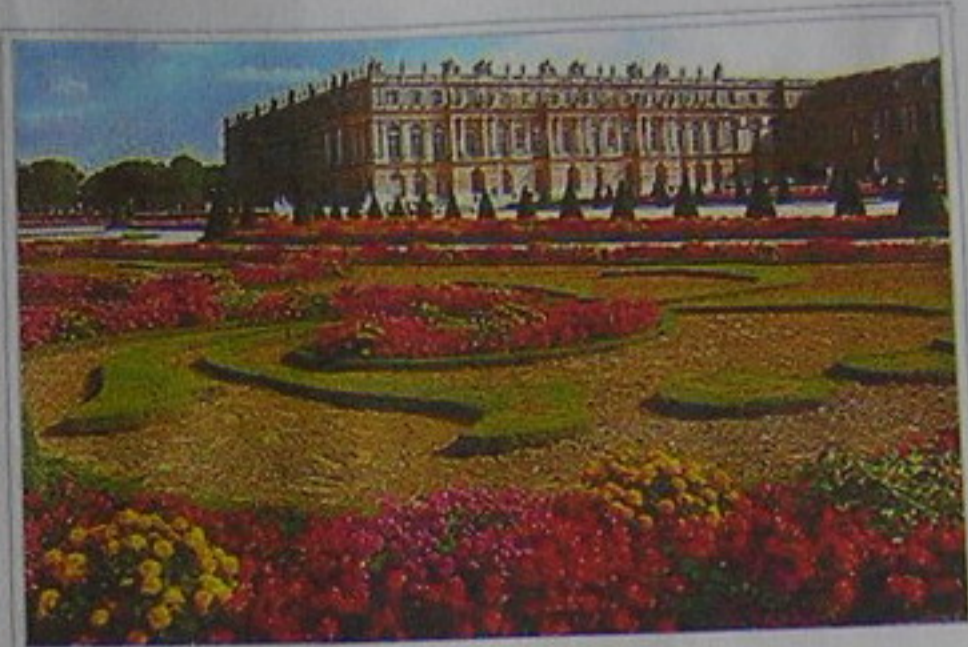
Versalles. Fachada sudoeste.