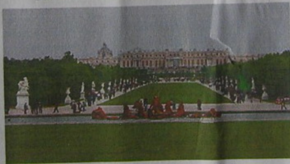
Vista del parque, al fondo el palacio.