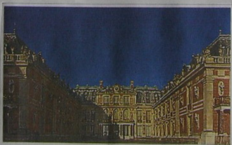
Palacio de Versailles.

Trianón fue declarada patrimonio de la humanidad por la Unesco en 1979