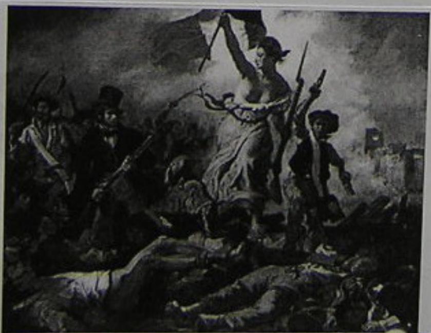
La Libertad guiando al pueblo (La Liberté guidant le peuple)

Otros cuadros importantes son, La Libertad Guiando al Pueblo, de Delacroix y Las Bodas de Caná, de Veronés.