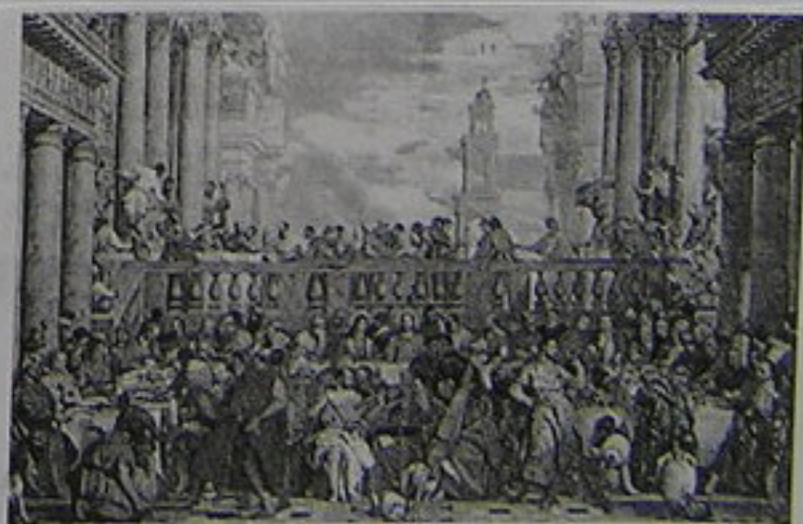
Las bodas de Caná