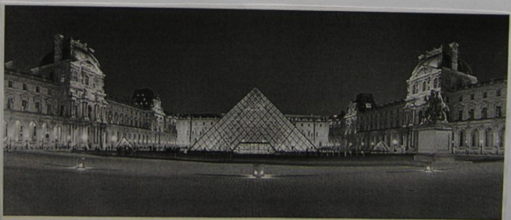
El patio del Museo del Louvre por la noche, con la Pirámide mostrada en el centro.

Las colecciones del Louvre proceden de los distintos reyes franceses, de los botines de la Revolución Francesa y de las guerras napoleónicas y de donaciones privadas.