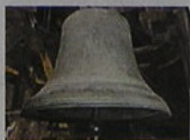
Emmanuel, la gran campana de Bourdon, en el Notre Dame

El interior de la catedral está iluminado con grandes vidrieras policromadas, o sea, con muchos colores.