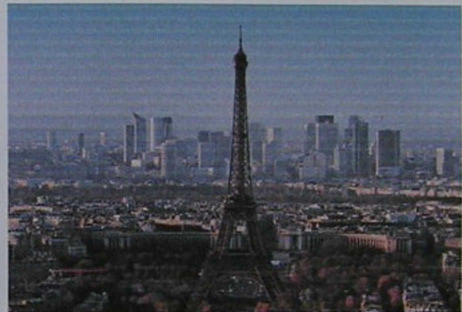
vistas de paris y la torre Eiffel