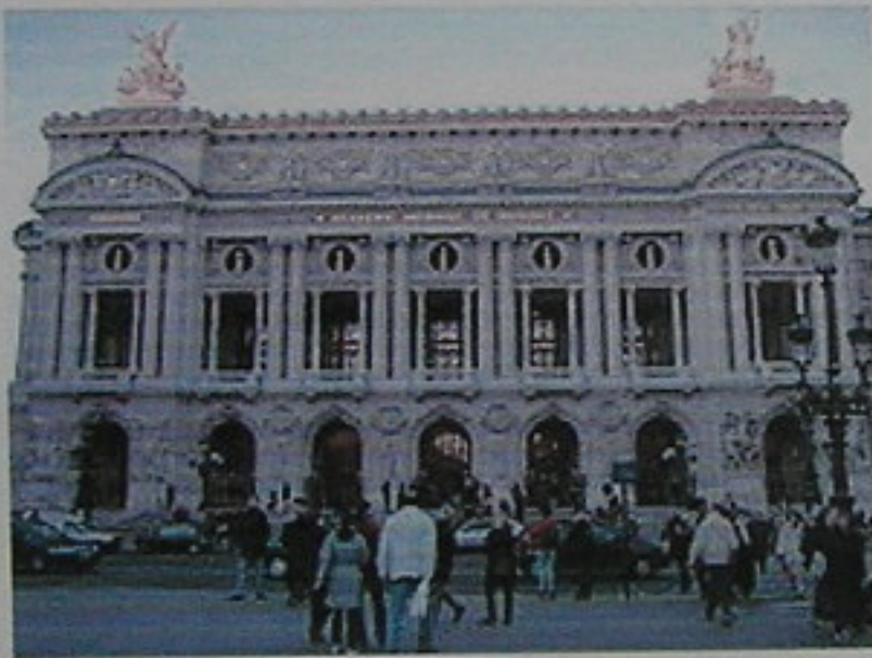
Opera de Garnier

El clima de París es oceánico semicontinental al encontrarse alejada de la costa. Llueve con abundancia aunque no es excesivo y esta repartida a lo largo de todo el año de forma regular. Las temperaturas son suaves todo el año. En verano se pueden superar los 30 °C a lo largo de toda la estación, aunque rara vez se superan los 35 °C; las temperaturas máximas suelen rondar entre los 25 °C y 30 °C y son frecuentes las tormentas. La primavera y el otoño son suaves, con muchos días de lluvia. El invierno no es muy riguroso, la temperatura media es de unos 5 °C, y se alternan días de lluvia y nieve.