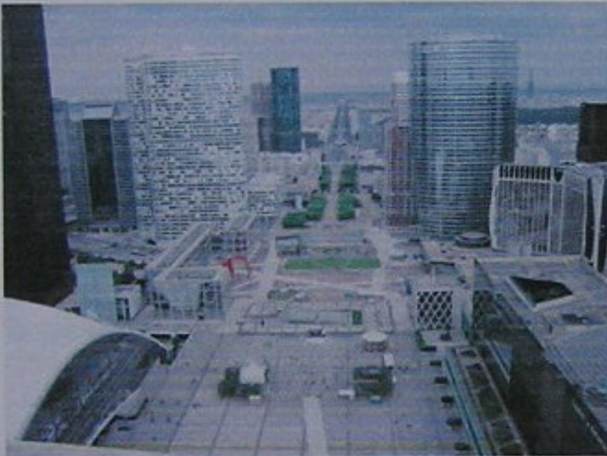
Barrio de la defense

La región de París es, junto con Londres, el centro económico más importante de Europa. La Défense es el primer barrio de negocios de Europa, alberga la sede social de casi la mitad de las grandes empresas francesas , así como la sede de veinte de las 100 más grandes del mundo. París también acoge muchas organizaciones internacionales como la Unesco, o la Cámara de Comercio Internacional.