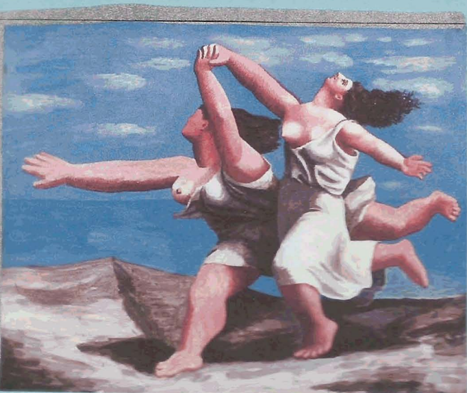
Mujeres comiendo por la playa