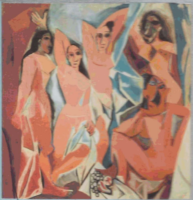
Señoritas de Avignon (1907)