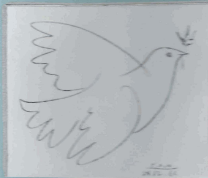
Paloma de la paz (1949)