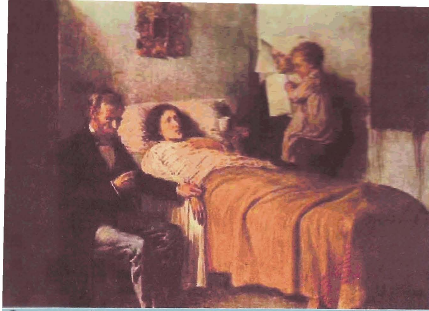
Ciencia y Caridad (1896)