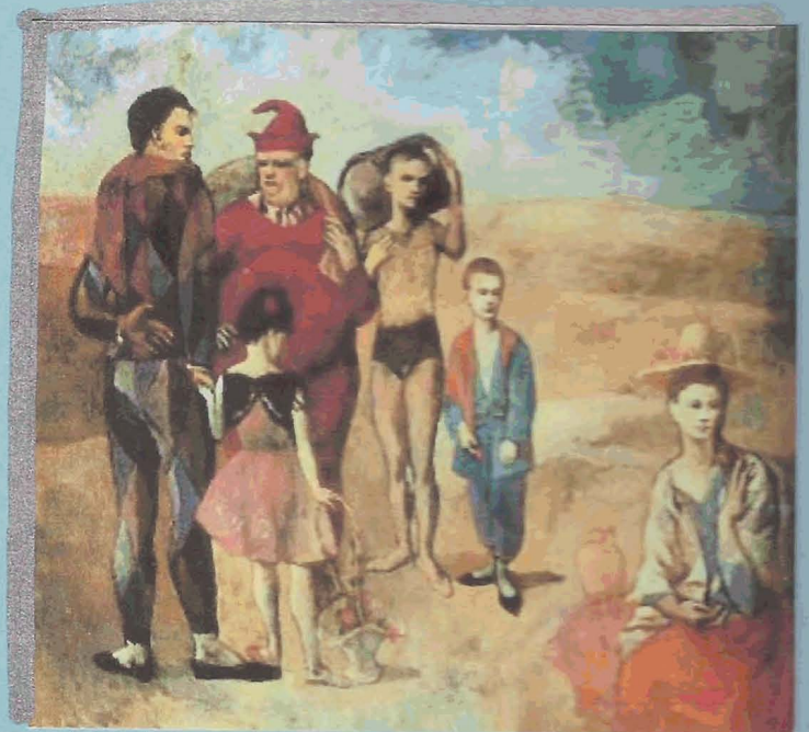
La familia de acrobatas (Época Rosa).