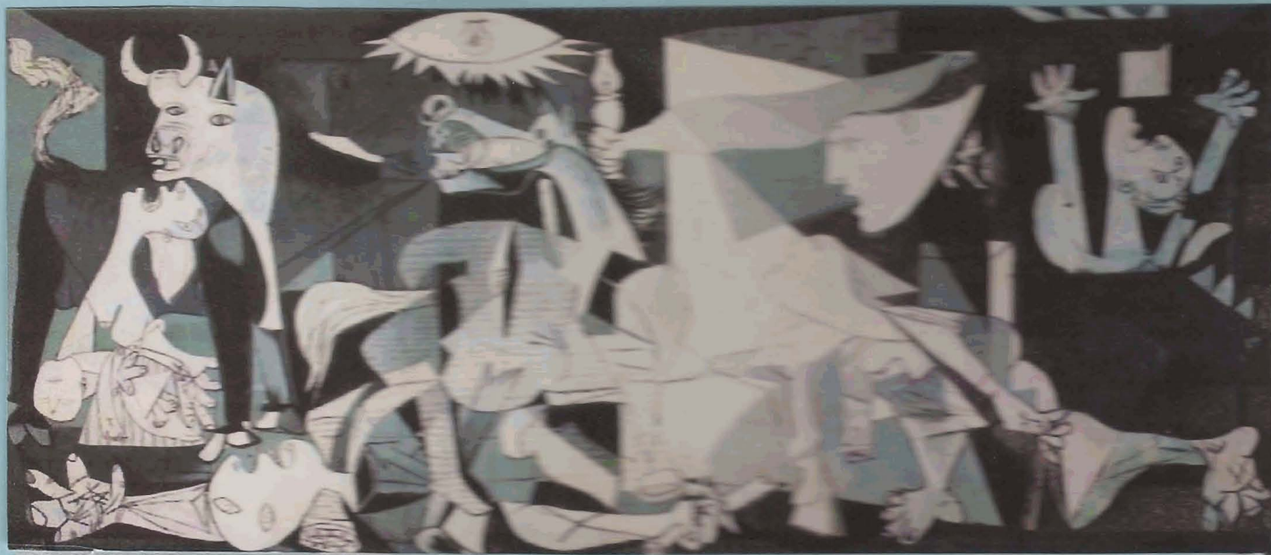
El Guernica (1937)