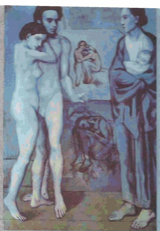
La vida (1903)