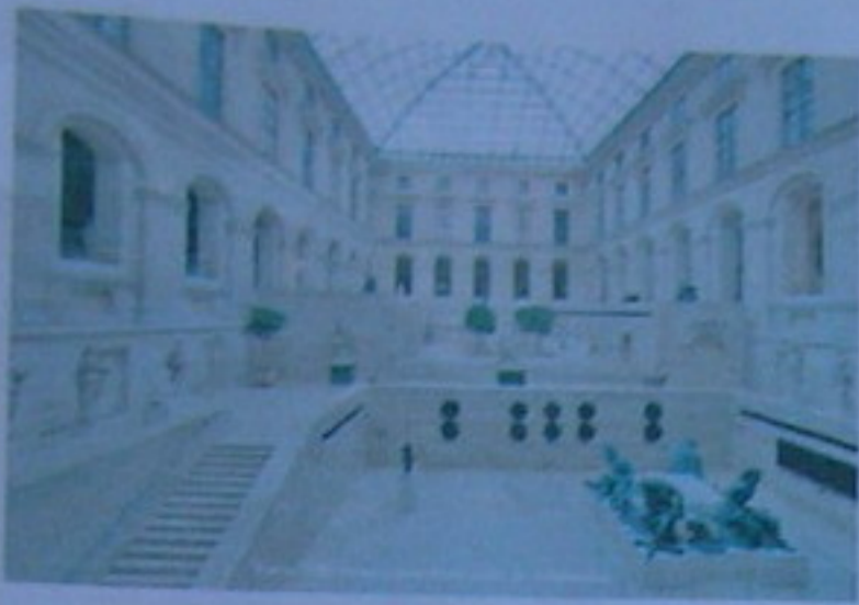
Imagen interior del Museo

Inspira reacciones de asombro en aquellos que lo visitan por primera vez. Y es tal su grandeza que a veces también inspira temor en sus visitantes quienes se dan cuenta de que es prácticamente imposible ver todo el museo en un solo día. En el Louvre se muestran obras de arte que datan de 1848 o antes.