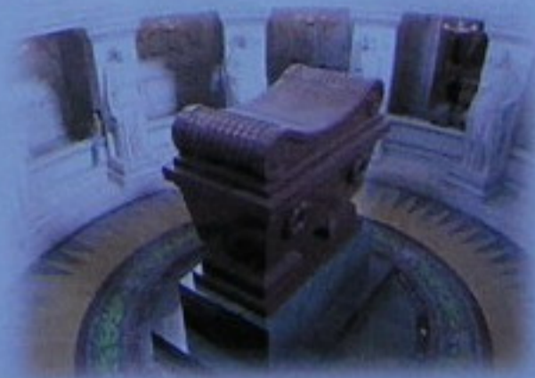
Panteón de Napoleón