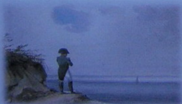
Napoleón en Santa Elena

A Napoleón le obligaron a renunciar a la soberanía de Francia e Italia para sí y su familia en 1814 y se exilió a la isla de Elba, una isla pequeña a 20 km de la costa italiana, manteniendo su título de emperador vitaliciamente. Más tarde pretendió volver a gobernar y fue encarcelado y desterrado por los británicos a la isla de Santa Helena en el Atlántico, el 15 de julio de 1815, donde murió 6 años después. Fue enterrado en esta isla, pero a los 20 años de su muerte, sus restos fueron trasladados a Paris y depositados, con todos los honores en Les Invalides.