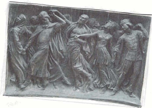
- Escenas - Calderón de la Barca -