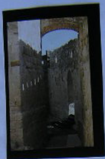
Interior del Castillo