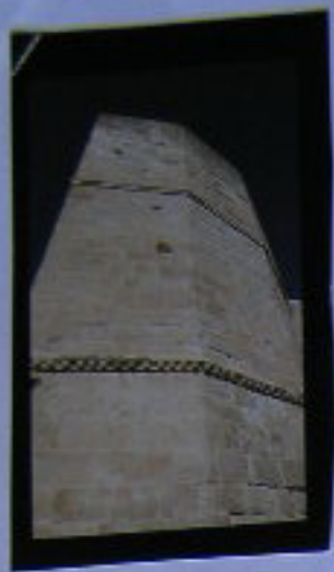
Torre del Homage