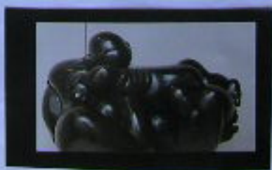
Escultura de Baltasar Lobo