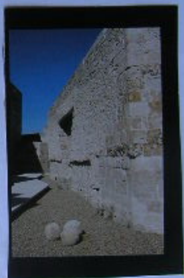
La Liza y local de las Cataquertas