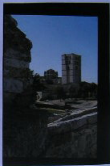
Vistas de la Catedral