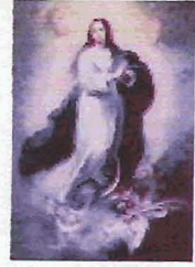
Inmaculada, Museo del Prado