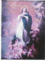
Inmaculada de Sout