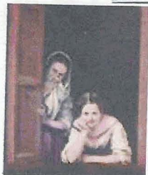
Mujeres en la ventana