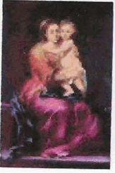
La Virgen del Rosario con el Niño