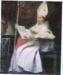
San Leandro, Catedral de Sevilla