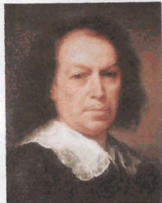
Murillo, autorretrato de 1670

Nacimiento 31 de diciembre, 1617 Sevilla, España