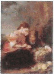
Vendedores de fruta (1670)