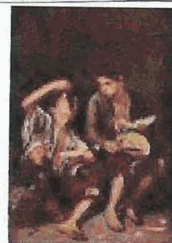
"Dos niños comiendo melón y uvas" Alte Pinakothek