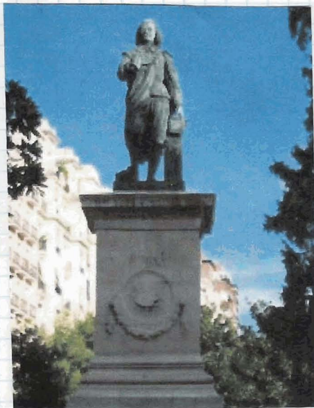
ESTATUA DE MURILLO EN MADRID

.-ELOGIO DE LAS BELLAS ARTES-. GASPAR MELCHOR DE JOVELLANOS. MADRID, 14 DE JULIO, 1781