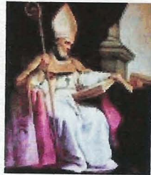
San Isidoro, Catedral de Sevilla