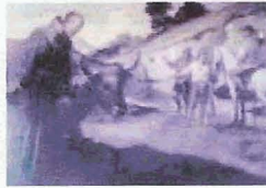
San Fracisco Solano, Alcazar, Sevilla