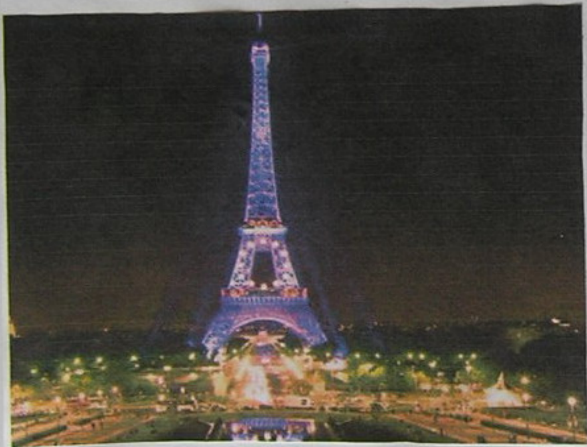
La torre Eiffel Paris (Francia).